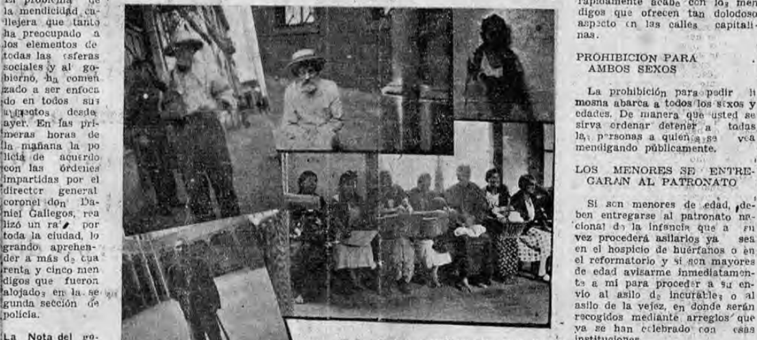
Varios de los mendigos que ayer fueron recogidos por las autoridades

Fué encargado el Patronato Nacional de la Infancia ayer de estudiar el caso de cada mendigo que sea recogido por la policía.—De hoy en adelante se hará el propio de recoger 16 personas de las que imploran la caridad pública diariamente