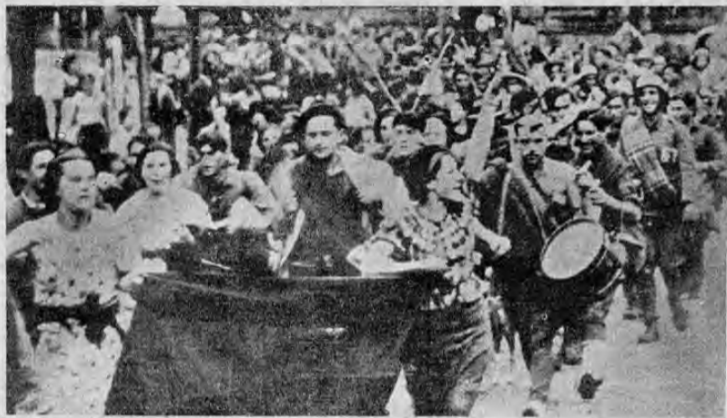
Emocionadas y llenas de júbilo, estas bellas muchachas, que portan banderas rojo y gualda, encabezaron la entrada a San Sebastián del primer destacamento de las tropas del general Mola, en el momento en que desfilan por las principales calles del aristocrático balneario.